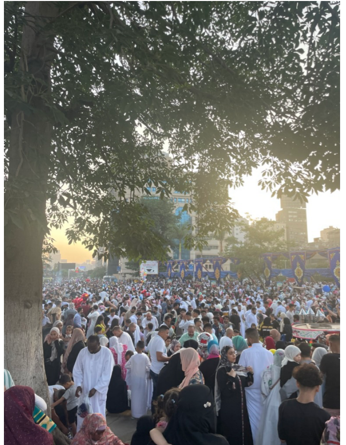
Het Offerfeest gebed