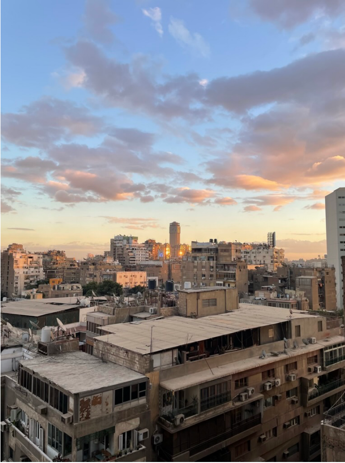
Uitzicht vanuit ons appartement