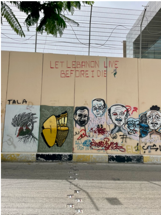
Protestmuur in Beiroet