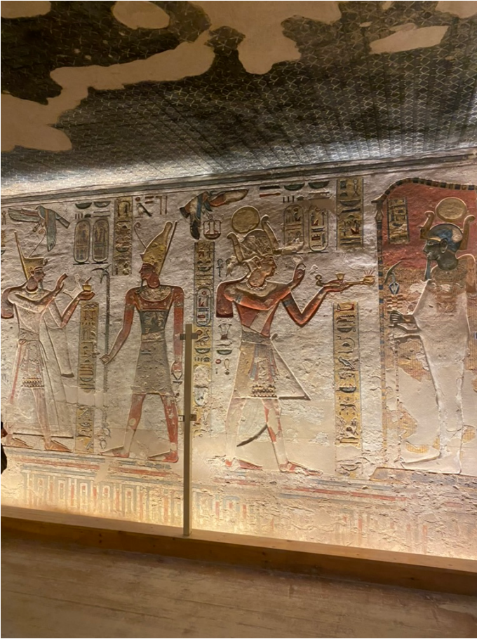
Vallei der Koningen, Luxor