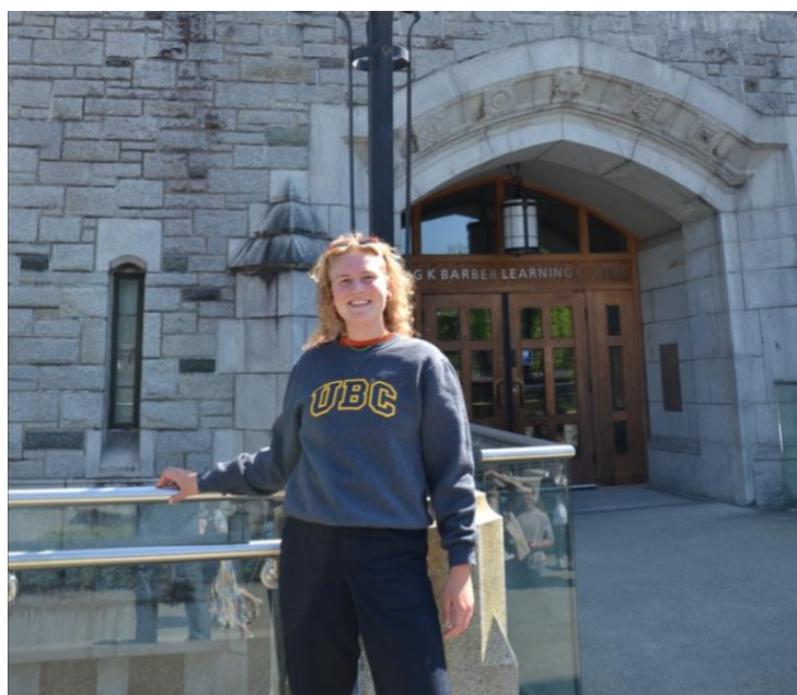
In mijn UBC-trui voor de Irving K. Barber Library, de bibliotheek waar ik altijd studeerde