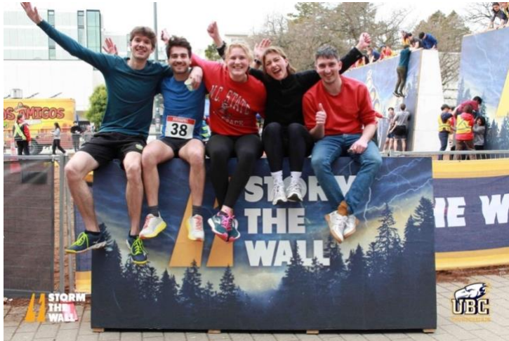
Teamfoto na Storm the Wall