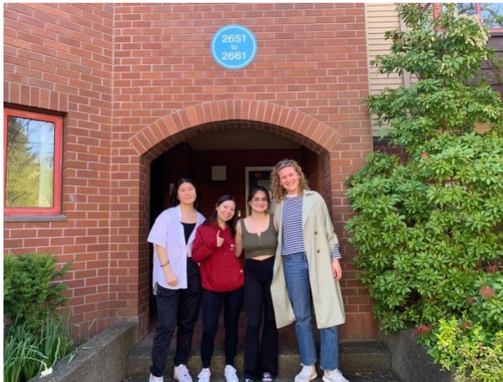
Met mijn huisgenoten voor ons huis