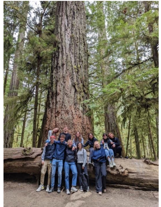
Groepsfoto in Cathedral Grove, Vancouver Island